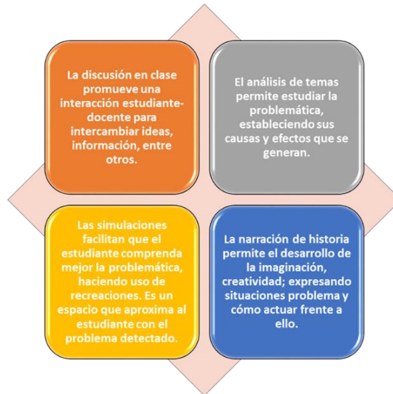
Figura 1. Estrategias. Elaboración: El autor.

Las estrategias son capaces de mejorar el aprendizaje de los estudiantes, incrementando sus conocimientos sobre temas ambientales. Además, se pueden propiciar un cambio positivo en la actitud hacia el medio ambiente, lo que indica que las estrategias didácticas ayudan a sensibilizar y concienciar a los alumnos sobre la importancia de cuidar y proteger nuestro entorno. Además, la participación de los estudiantes durante la implementación de diferentes estrategias demuestra la efectividad de estas para fomentar el compromiso y la motivación en el aprendizaje (Marlés Betancourt et al., 2021; Parra y Molina, 2023). Los estudiantes demuestran un mayor interés y motivación por aprender sobre temas ambientales (Abad Abad, 2023). En este proceso el rol del docente es de suma importancia como promotor y acompañante del proceso educativo, ya que incorpora las mejoras significativas de la educación ambiental, por ello el docente debe tener en cuenta un abanico de estrategias para ser aplicadas en distintos momentos de la enseñanza y de esta manera lograr aprendizajes significativos en los estudiantes (Barboza Contreras y Soto López, 2021).