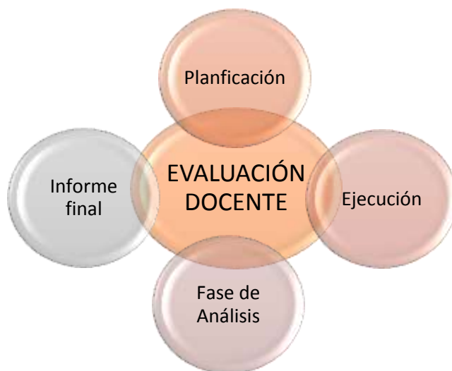
Figura 2. Proceso de Evaluación Docente de la Universidad Católica de Cuenca.

El proceso de evaluación del desempeño docente de la Universidad Católica de Cuenca, sede Azogues, consta de 4 sub procesos los mismos que se muestran en la figura 2.