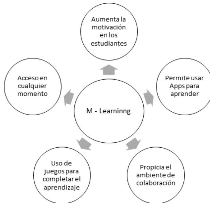
Figura 1: Proceso de planificación M – Learning.